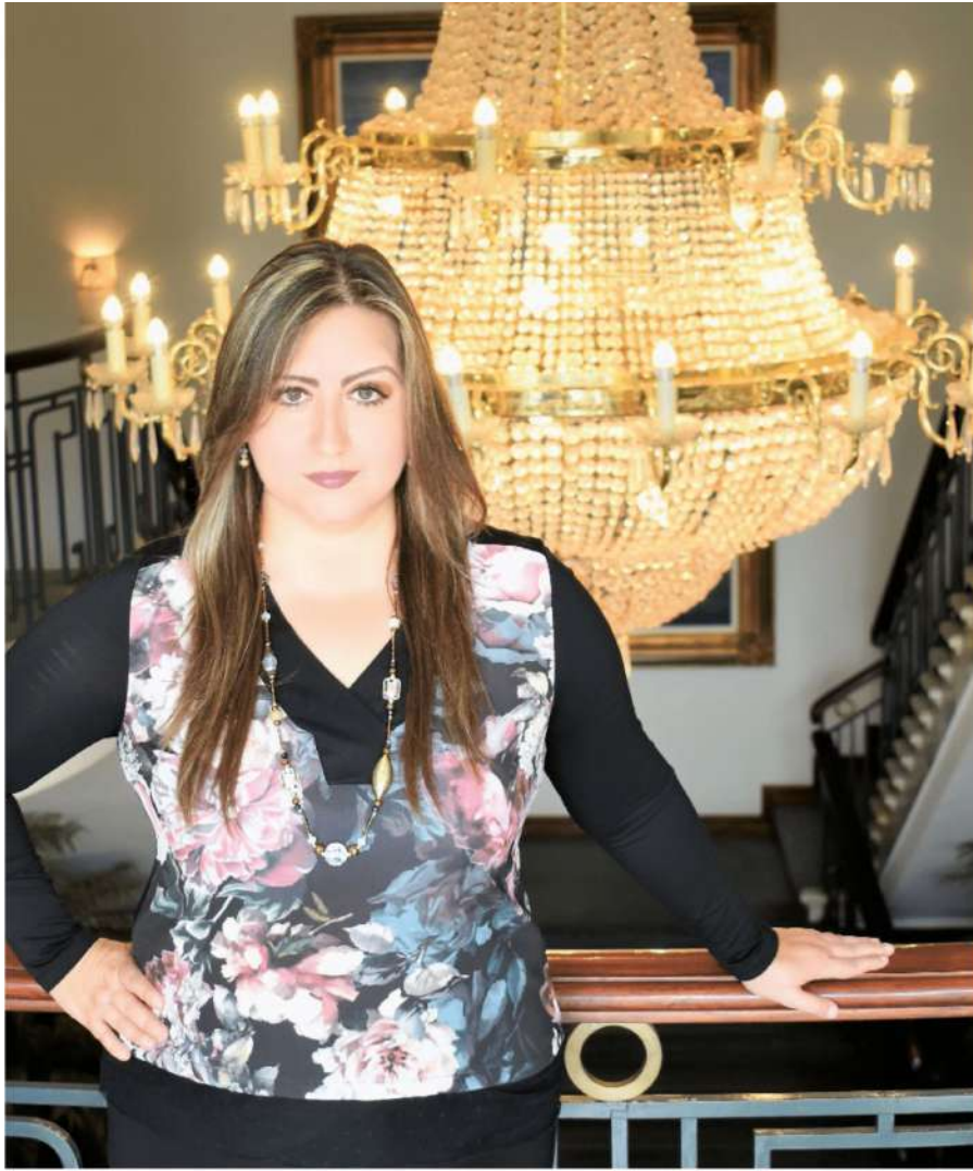
Sus pasatiempos favoritos son leer libros de Comunicación y Astrología.

“Antes de dirigir Viajes Cóndor tuve una mala experiencia con una agencia ya que después de contratar un viaje nunca se tomaron la molestia de saber cómo me fue, si regresé o no; eso me marcó y por ello en la agencia estamos pendientes de asesorar al cliente antes y después del viaje, tenemos constante comunicación con ellos y buscamos una retroalimentación”.